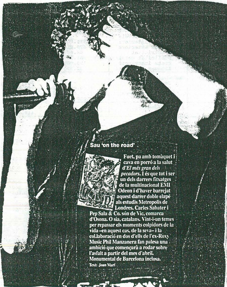
Sau 'on the road'

Es a punt de finalitzar la primera fase d'arranjaments, en una diguem-ne primera passada d'urgència. Properament i ja amb càrrec al pressupost d'enguany, s'estudiarà un pla per asfaltar a poc a poc tota la xarxa, començant pels mes usats actualment.